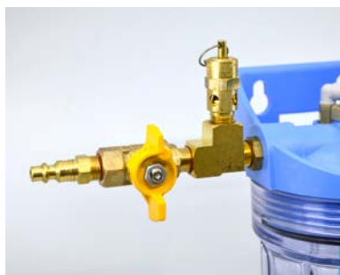
Attacco a Sinistra standard per aria compressa