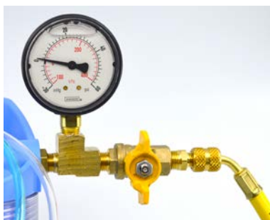
Attacco a Destra fornito con tubi al mono con valvole unidirezionali e raccordo 2 in 1